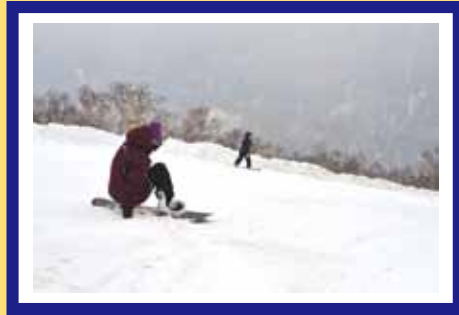
五合目にも雪がいっぱい！