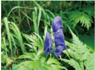
ダイセツトリカブト