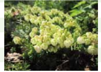
アオノツギザクラ