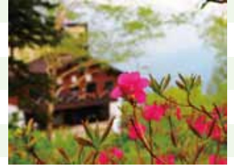
ムラサキヤシオツツジ

お花の中が赤になると 養分が完了した証! 五合目はもちろん 登山道にもたくさん♪