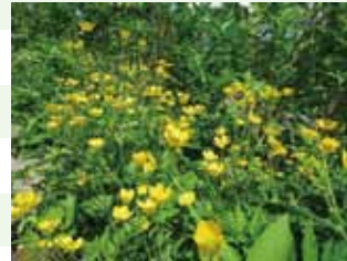
ミヤマキンポウゲ

お花、綿毛、草紅葉と 三つの姿を楽しめます。 駅舎前、リフトなどで 観察できます。