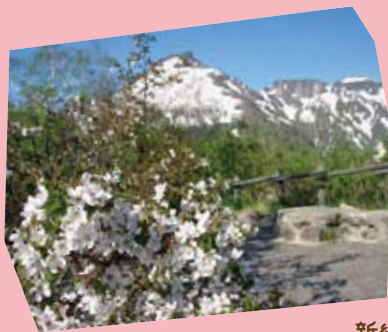
残雪の黒岳と 千シマザクラ

長い冬を終え、黒岳にもようやく春が！ 日本一遅咲きの桜、千シマザクラが美しく咲き誇ります。