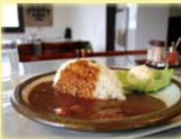
ポテトサラダ付き カレーライス ¥550