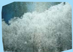
ダイヤモンドダスト