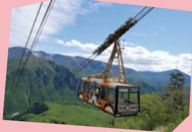
新緑とロープウェイ