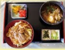
豚丼 & ミニ黒岳そば 黒岳セット ¥950